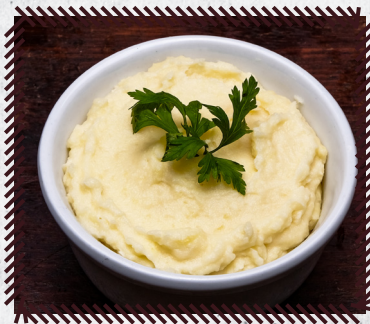
1061 PURÊ R$ 15,90