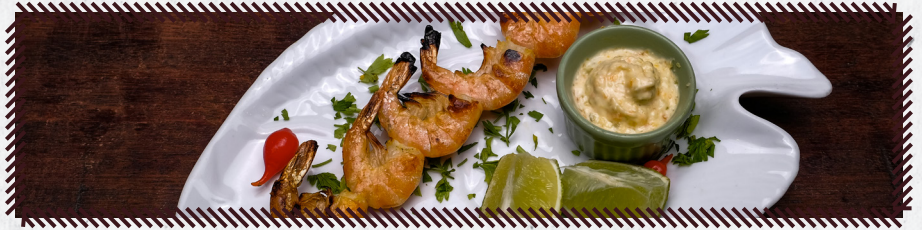
19 CAMARÃO R$ 22,90