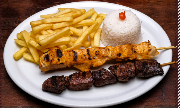
1013 PEROBAH 2 ESPETOS R$ 44,90