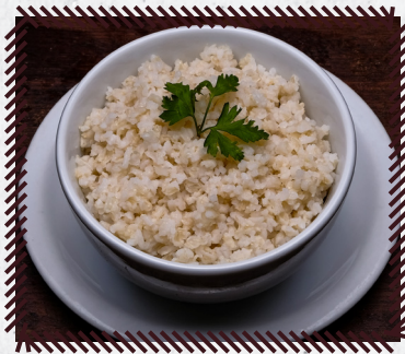
1070 ARROZ INTEGRAL R$ 21,90