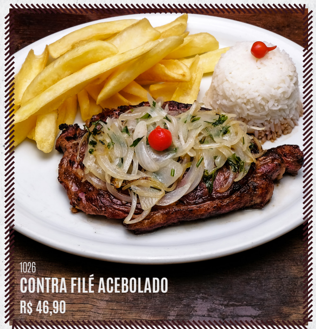
1026 CONTRA FILÉ ACEBOLADO R$ 46,90

*TODOS OS PRATOS ACOMPANHAM: ARROZ (À SUA ESCOLHA), BATATA (À SUA ESCOLHA), FEIJÃO E SALADA.