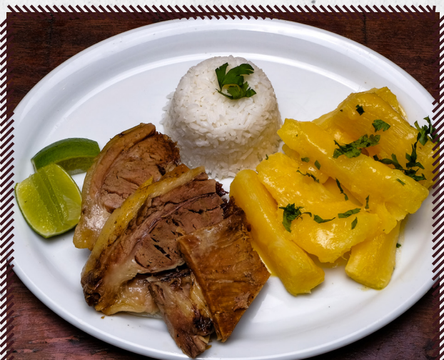
1035 COSTELA NO BAFO R$ 44,90