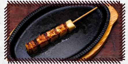
35 QUEIJO COALHO R$ 10,90