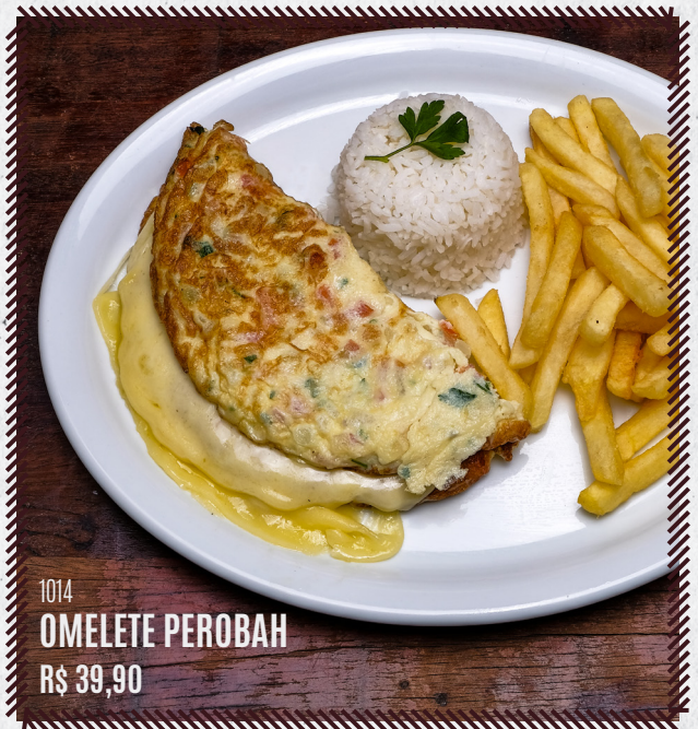
1014 OMELETE PEROBÁH R$ 39,90

*TODOS OS PRATOS ACOMPANHAM: ARROZ (À SUA ESCOLHA), BATATA (À SUA ESCOLHA), FEIJÃO E SALADA.