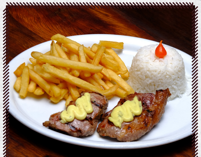
13097 MAMINHA NA MANTEIGA R$ 48,90