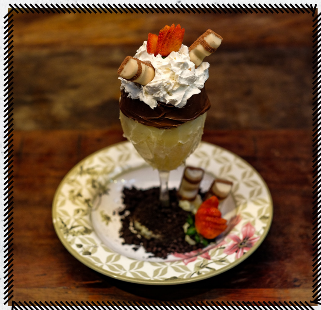
10337 TAÇA BUENO R$ 49,90