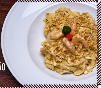
1073 FETTUTINE ALFREDO COM CAMARÃO R$ 54,90