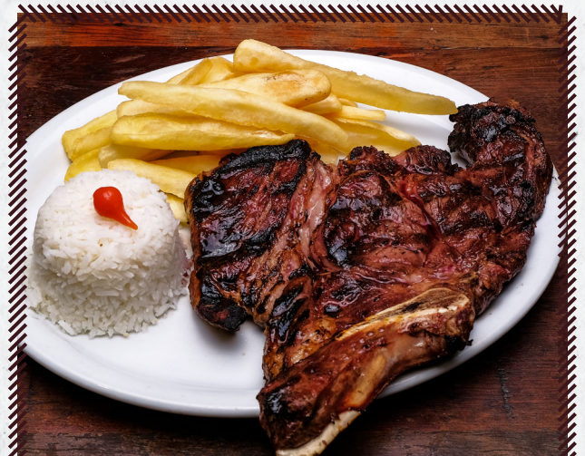
1034 CHULETA (ANGUS) R$ 61,90