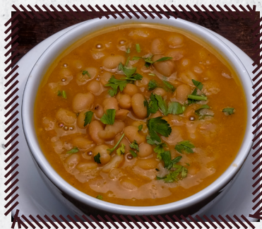
77 FEIJÃO R$ 20,90