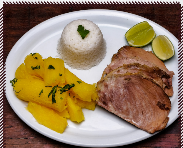
1033 CUPIM R$ 46,90