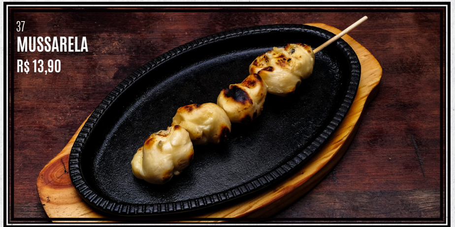
37 MUSSARELA R$ 13,90