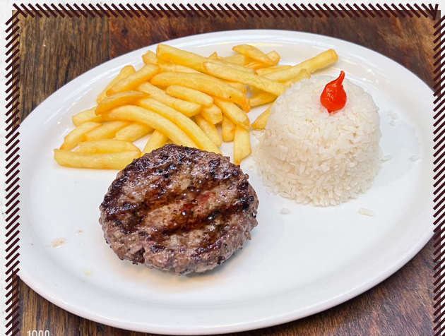
1022 HAMBURGUER DE COSTELA R$ 40,90