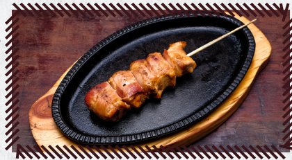
9 MEDALHÃO DE FRANGO R$ 17,90