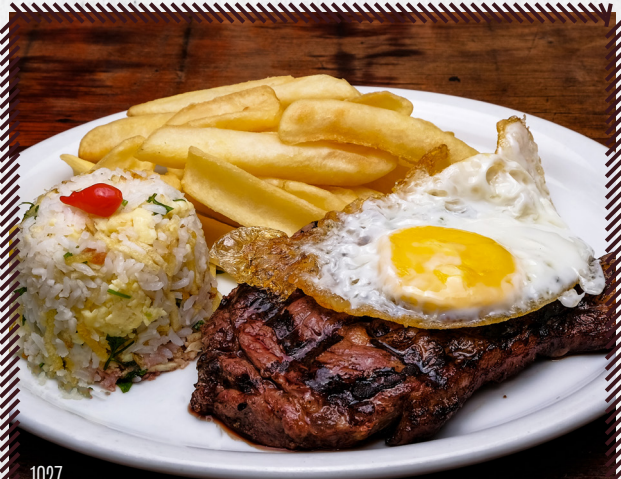
1027 CONTRA FILÉ À CAVALO R$ 46,90