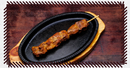
10 FRANGO R$ 11,90