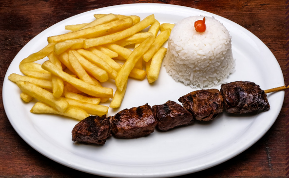
1011 PEROBAH 1 ESPETO R$ 35,90