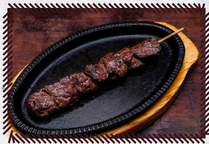
6 ALCATRA R$ 12,90