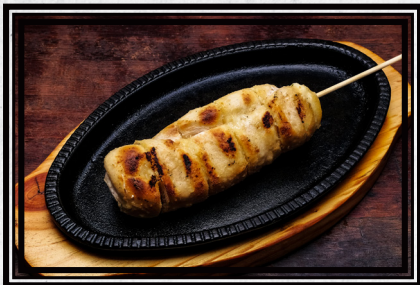
36 PÃO DE ALHO R$ 10,90