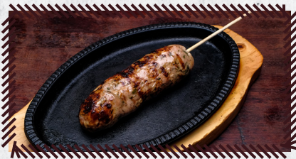
20 CUIABANA FRANGO R$ 17,90