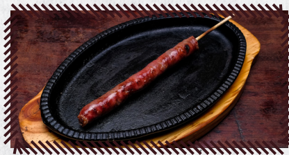
24 LINGUIÇA ESPECIAL COM QUEIJO R$ 14,90