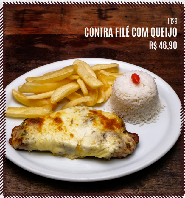
1029 CONTRA FILÉ COM QUEIJO R$ 46,90