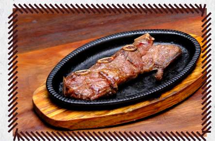
5 ASSADO DE TIRA R$ 33,70