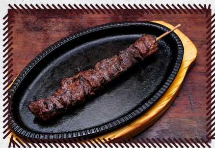
3 FILÉ MIGNON R$ 25,90