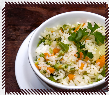
80 ARROZ À GREGA R$ 23,90