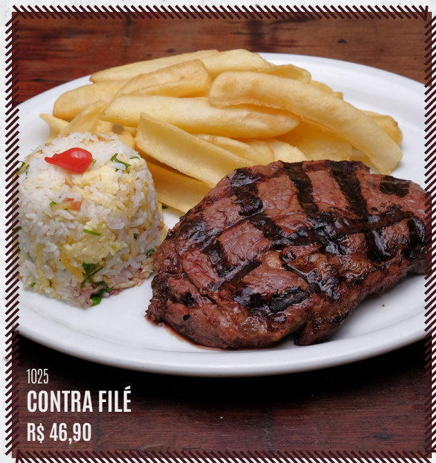
1025 CONTRA FILÉ R$ 46,90