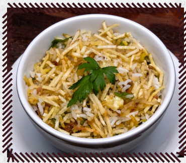
82 ARROZ BIRO BIRO R$ 24,90