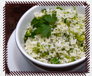
83 ARROZ COM BROCÓLIS R$ 24,90