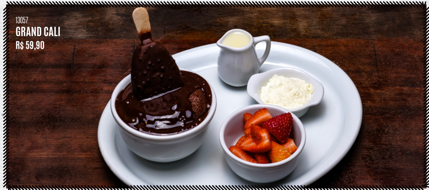
13057 GRAND CALI R$ 59,90