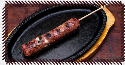
33 KAFTA R$ 13,90