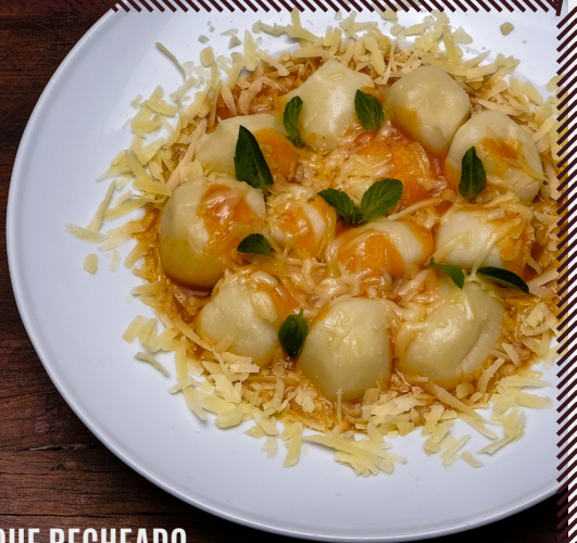
1072 NHOQUE RECHEADO R$ 42,90