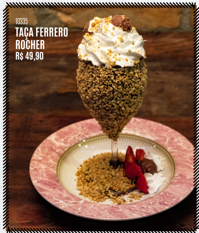
10335 TAÇA FERRERO ROCHER R$ 49,90