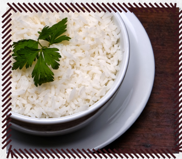
78 ARROZ BRANCO R$ 16,90