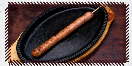
27 LINGUIÇA DE FRANGO R$ 12,90