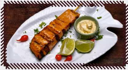
18 SALMÃO R$ 38,90