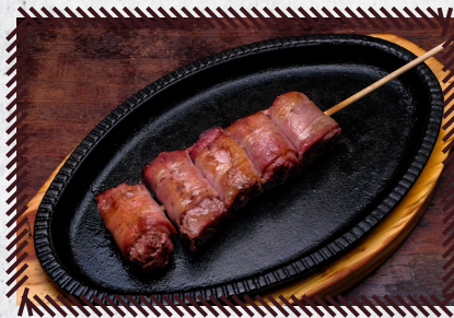
7 MEDALHÃO DE FILÉ MIGNON R$ 27,90