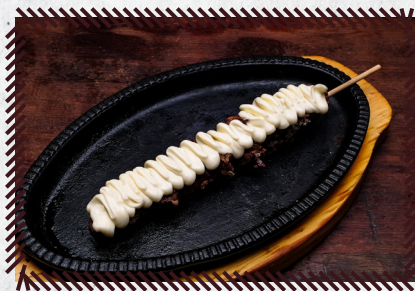
4 FILÉ MIGNON COM CATUPIRY R$ 27,90