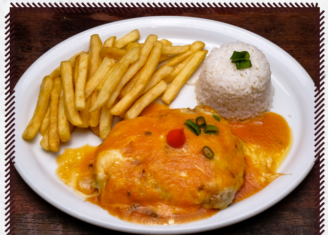
1023 HAMBURGUER DE COSTELA À PARMEGIANA R$ 41,90