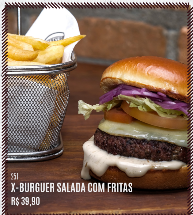
251 X-BURGUER SALADA COM FRITAS R$ 39,90

NA COMPRA DE 1 PRATO EXECUTIVO + R$ 5,90 LEVE 1 PUDIM DE SOBREMESA