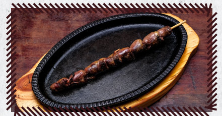
12 CORAÇÃO R$ 11,90