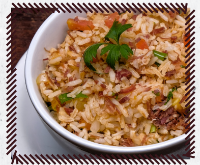
79 ARROZ CARRETEIRO R$ 25,90