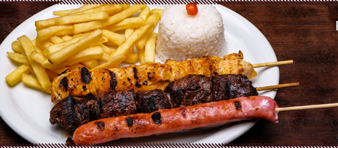
1012 PEROBAH 3 ESPETOS R$ 49,90

ESPETOS: CARNE, FRANGO, LINGUIÇA, LINGUIÇA DE FRANGO, LINGUIÇA APIMENTADA, LINGUIÇA COM QUEIJO, PANCETA, KAFTA, KAFTA COM QUEIJO, COPA LOMBO, CORAÇÃO, COSTELINHA, PÃO DE ALHO, QUEIJO COALHO OU MUSSARELA.