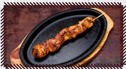
15 COPA LOMBO R$ 11,30