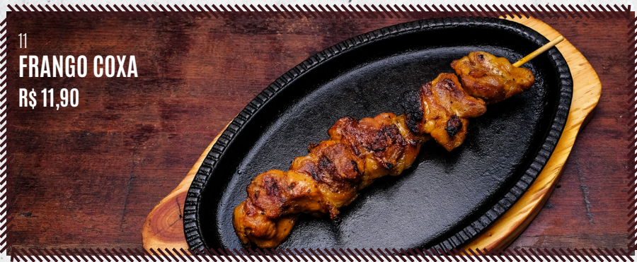
11 FRANGO COXA R$ 11,90