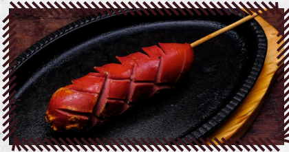
31 SALSICHÃO R$ 14,90