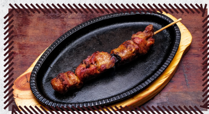
16 COSTELINHA SUÍNA R$ 15,90