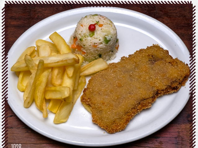
1028 CONTRA FILÉ À MILANESA R$ 46,90