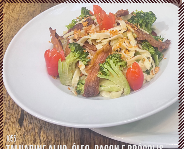
1055 TALHARINE ALHO, ÓLEO, BACON E BRÓCOLIS R$ 42,90