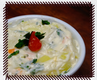
1062 MAIONESE R$ 15,90