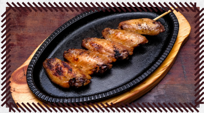
8 TULIPA R$ 12,90