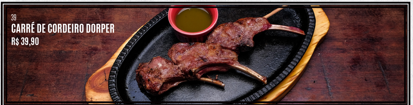
39 CARRÉ DE CORDEIRO DORPER R$ 39,90