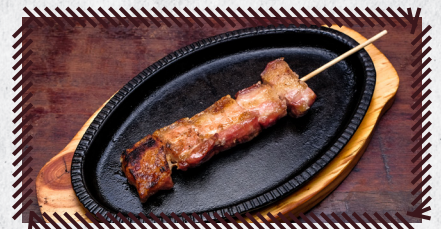
17 PANCETA R$ 12,90